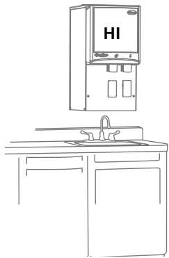
Mostrado sin bandeja de drenaje

1 Unidades configuradas con bandeja de drenaje.