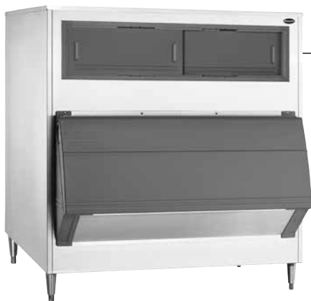
Jedyna w branży osłona lodu SmartGATE