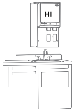
Mostrado sin bandeja de drenaje

1 Unidades configuradas con bandeja de drenaje.