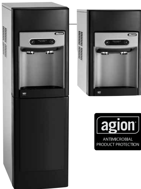
Illustré avec pied optionnel