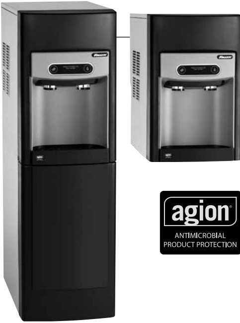
Показано с дополнительной подставкой